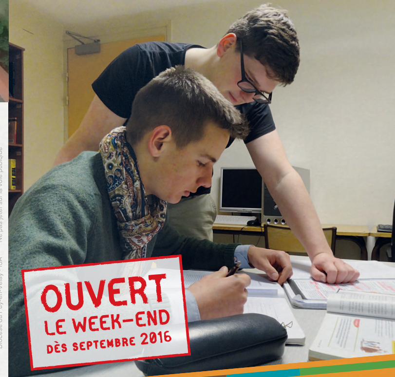
Diocèse du Puy-en-Velay - LIA Ne pas jeter sur la voie publique